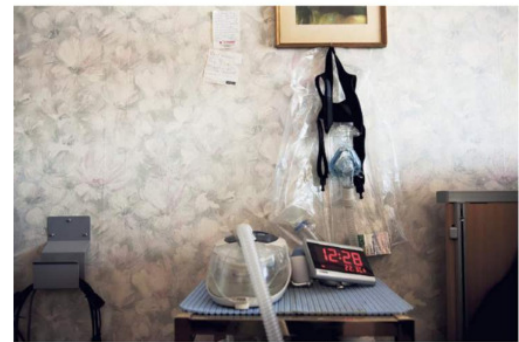
In de thuiszorg verdwijnen volgens berekeningen van het kabinet circa 30.000 banen.